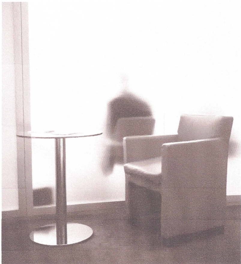
Confrontée au suicide d'un salarié, l'entreprise doit impérativement briser le silence.

Longtemps, chez les employeurs, le suicide est resté tabou. En témoignage ce manager d'une multinationale à la tête de sept commerciaux dont l'un s'est pendu en mai dernier : « Personne n'est venu à moi, ni les